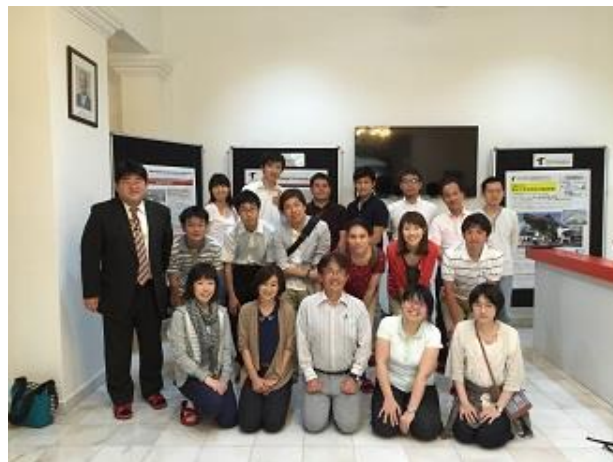
写真 6 1 月期海外研修者とスタッフ

今回学んだ事を鶴岡高専内での教職員及び学生間の共有に留まらず、特に東北の各高専でも共有したいと思います。更に自分自身の今後の学生指導等の活動にも活かしていきたいと思っています。