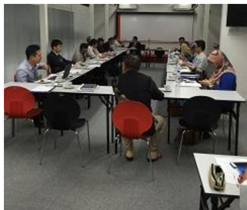
写真 2 マレーシア ペナン校にて実務研修