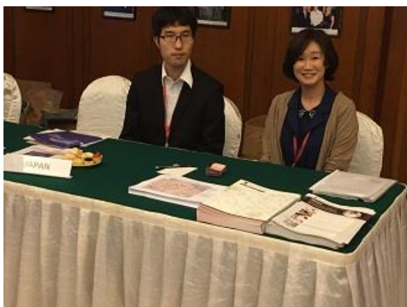
写真 4,5 IGNITE2016 スタッフとして参加