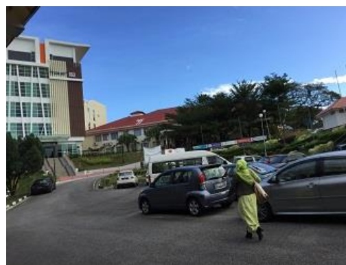
写真 3 マレーシア科学大学にて実務研修