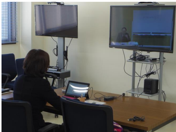
写真 6 国際法務研修 (GI-net)