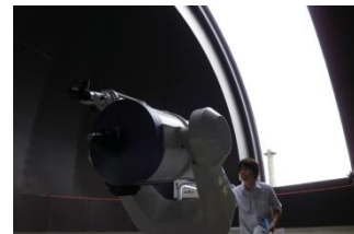
天体ドーム 天体望遠鏡の取扱い方