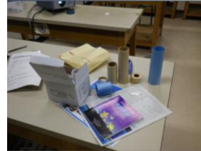
組立て天体望遠鏡一式